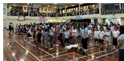
【補習校祭り全校合唱】

今学期に行いました補習校祭りでは、保護者の皆様方からご協力をいただき、子供たちの笑顔や頑張りをたくさん見ることができました。保護者の皆様には、今後とも本校の教育活動に対しまして、ご理解とご協力をよろしくお願いいたします。それでは、これから長いホリデーに入ります。子供たちにはこの期間を効果的に活用し、様々な体験を通してひと回り成長してほしいと思っております。4学期に、そんな子供たちと再会できることを、とても楽しみにしています。