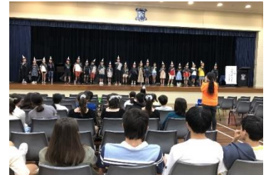
小3 合唱「おかしなすきなまほう使い」