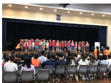
小2 朗読劇「スイミー」