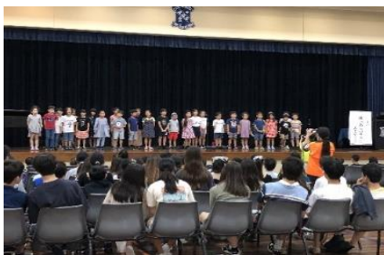
小1 歌「あおいそらにえをかこう」

どの学年も素晴らしい発表でした。学年の特色(幼稚部から中学3年まで)があり、様々な工夫が見られた発表に感心しました。4月からの約8か月で大きく成長した姿を見ることが出来ました。幼稚部・小学部の発表を見ていて、日頃の先生方のきめ細やかな授業の延長線上にこの学習発表会があることを改めて認識できました。中学部は、中学生らしく落ち着いていて下級生を思いやる心もあり、さすがでした。大きく成長している姿に嬉しく思いました。たくさんの方々のおかげで学校行事が成り立っていることを確認することができた一日でもありました。心から御礼申し上げます。