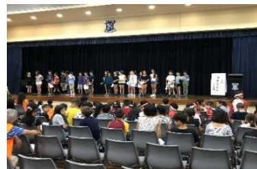
小6「日本なんでもクイズ」