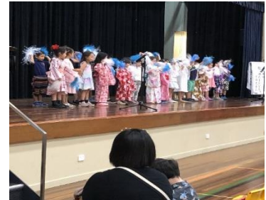
幼稚部歌「夢をかなえてドラえもん」