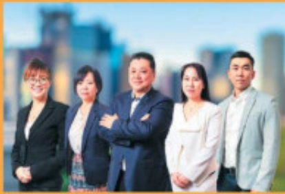
在豪30年以上の信頼と実績