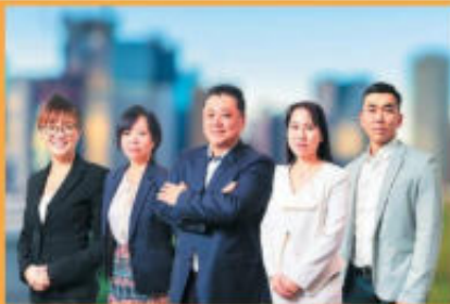
在豪30年以上の信頼と実績