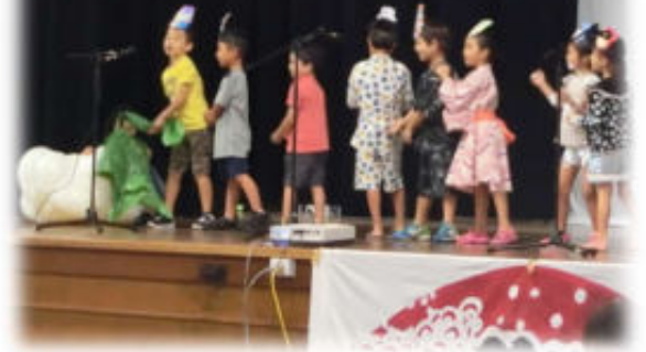
昨年のステージから

3学期スタート。実りの秋、いや春です。 3学期は補習校祭りが最大の行事です。今年も午前中は学習発表会、午後はタレントショーやラッフル、模擬店があります。学習発表会では国語の授業の延長としての表現活動、あるいは日頃できない音楽など各学年で工夫を凝らした発表をします。午後は、保護者会を中心に模擬店など楽しい催しを予定しています。時期が近まりましたら詳しいご案内をしますので、楽しみにしててください。保護者の皆様にはいろいろな面でご協力を頂くこととなりますが、どうぞよろしくお祈りします。