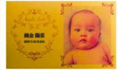
ご出産のお祝いに..