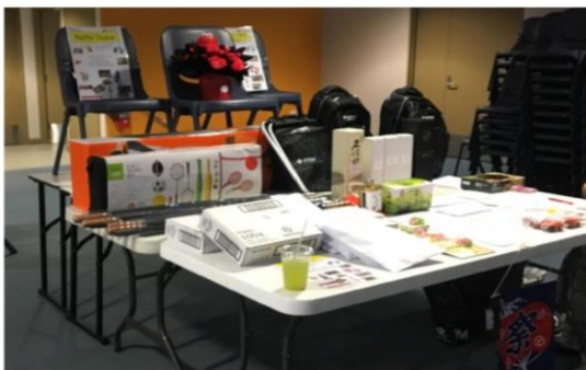
補習校祭りでの様子