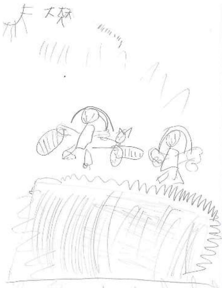
2年2組 大森 せな