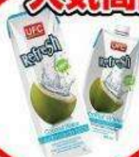
ココナッツウォーター 1L・500ML 2ダースよりお届け