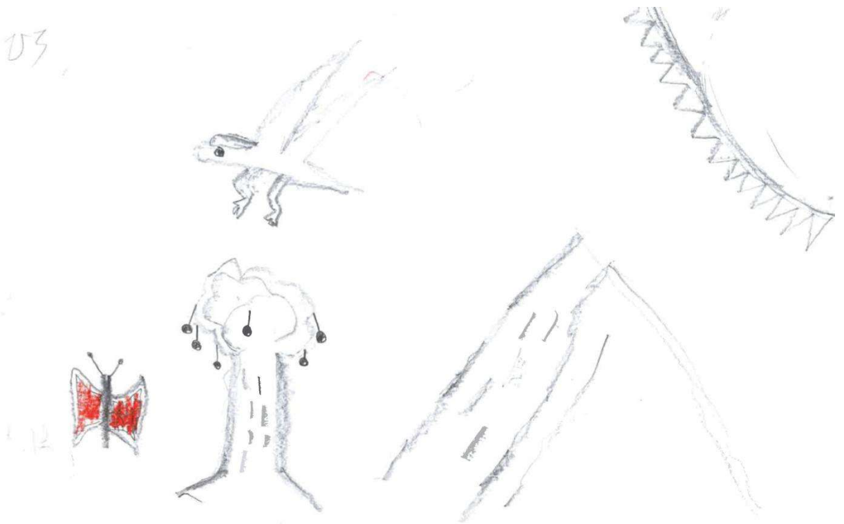
2年2組 杉村 ひろ