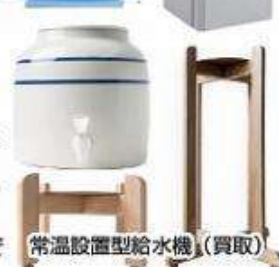
常温設置型給水機 (買取)