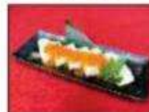
イクラぶっかけだし巻玉子