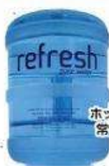
ホット&コールド給水機 常温&コールド給水機 (レンタル)

suka@refreshwaters.com.au T:0422-604-130 担当須賀まで